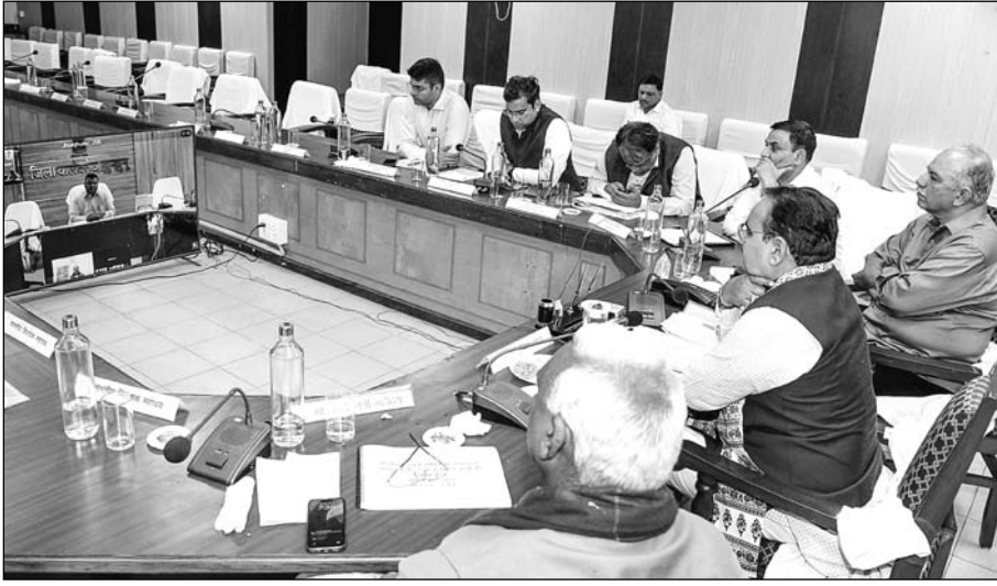
मुख्यमंत्री भजनलाल शर्मा ने शनिवार को भरतपुर के जिला कलेक्टर सभागार में वीडियो कॉन्फ्रेंसिंग के जरिए विभिन्न जिला कलेक्टरों से ओलावृष्टि पर वार्ता की।

कुछ जिलों में हुई ओलावृष्टि एवं इससे हुए नुकसान की विस्तृत जानकारी ली। शर्मा ने राजस्व विभाग के प्रमुख शासन सचिव को निर्देश दिए कि ओलावृष्टि से प्रभावित जिलों में फसल खराबे का आकलन करने के लिए शीघ्र गिरदावरी करवाई जाए। मुख्यमंत्री ने सीकर, चूरू, बीकानेर, झुंझुनू, एवं खैरथल-तिजारा के जिला कलेक्टर को निर्देशित किया कि गिरदावरी करवाकर रिपोर्ट शीघ्र भेजें। उन्होंने 7 डी रिपोर्ट को भी 5 मार्च तक प्रस्तुत करने के निर्देश दिए, जिससे