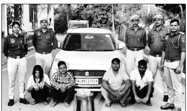
बगरू थाना पुलिस ने कार्रवाई करते हुए 22 फरवरी को प्रेम प्रसंग में बाधा बन रहे पिता पर फायरिंग करवाने वाला पुत्र व उसकी प्रेमिका सहित चार आरोपियों को गिरफ्तार किया गया है।

जयपुर। बगरू थाना पुलिस ने कार्रवाई करते हुए 22 फरवरी को प्रेम प्रसंग में बाधा बन रहे पिता पर फायरिंग करवाने वाला पुत्र व उसकी प्रेमिका सहित चार आरोपियों को गिरफ्तार किया गया है। साथ ही पुलिस ने गिरफ्तार आरोपियों के कब्जे से वारदात में प्रयुक्त हथियार एक देशी कट्टा, 4 जिन्दा कारतूस, 1 खाली केस व वाहन कार स्विच कार भी बरामद की है। फिलहाल आरोपियों से पूछताछ की जा रही है।