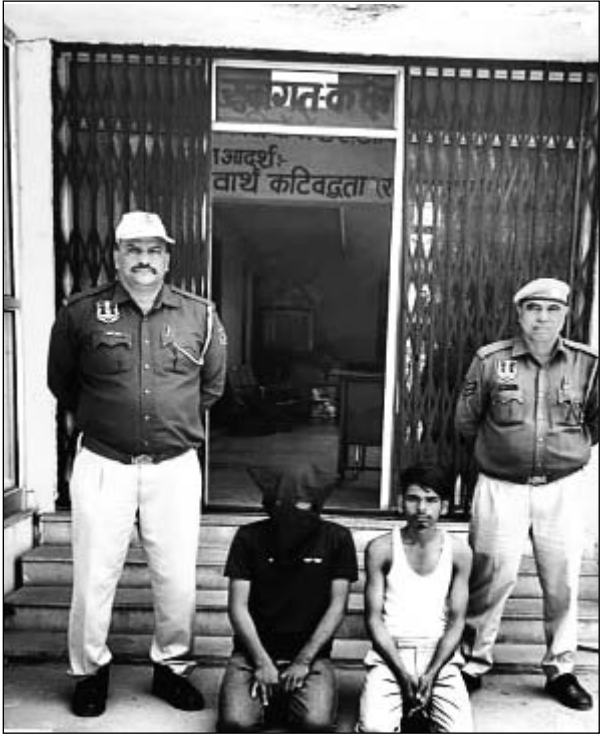
बिंदायका थाना पुलिस ने फिल्मों स्ट्राइल में पिता-बेटे से लूट की वारदात को अंजाम देने वाले दो बदमाशों को गिरफ्तार किया है।

जयपुर। बिंदायका थाना पुलिस ने फिल्मों स्ट्राइल में पिता-बेटे से लूट की वारदात को अंजाम देने वालों को गिरफ्तार किया है। पुलिस जांच में सामने आया है कि बदमाशों ने पहले चाकू की नोक पर पिता से ऑनलाइन रुपए ट्रांसफर करवाए। फिर बेटे को कॉल कर पिता का एक्सिडेंट होना बताकर रुपए ऐंट लिए। पुलिस ने सीसीटीवी फुटेज के आधार पर दोनों बदमाशों को दबिश देकर गिरफ्तार कर लिया है। पुलिस ने आरोपियों के कब्जे से वारदात में प्रयोग बाइक भी बरामद की है। फिलहाल आरोपियों से पूछताछ की जा रही है।