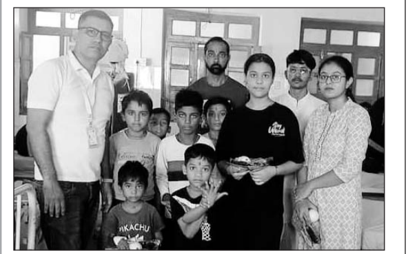
द संजीवनी लाइफ बियोन्ड की ओर से कैंसर पीड़ित बच्चों को कलर बुक, कलर्स, कैप, जुराबे व स्माइल बाल्स बांटे।