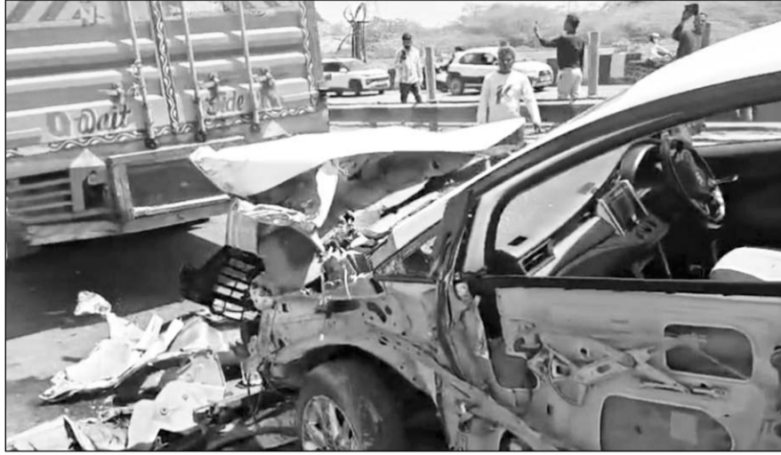
एक के बाद एक कई वाहन टैंकर में पिछे से टकरा गये।

उदयपुर, (कासं)। उदयपुर शहर के प्रतापनगर थाना क्षेत्र के देवारी पावर हाउस के पास गुरुवार दोपहर भीषण हादसा हो गया। चित्तौड़गढ़ से उदयपुर की तरफ आ रहे एक टैंकर ने हाइवे पर देवारी पावर हाउस के पास अचानक अनियंत्रित होकर कई वाहनों को चपेट में ले लिया। इस दौरान पीछे आ रही कारों भी टैंकर से टकराए एक-दूसरे से भिड़ती चली गयीं। 10 से 12 कारों, ऑटो, टैपो और एक बाइक बुरी तरह क्षतिग्रस्त हो गईं और मौके पर चीख-पुकार मच गयी।