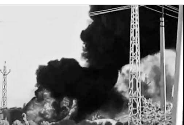
आग की लपटें दूर तक दिखाई दीं। वहीं दमकल कर्मियों ने करीब डेढ़ घंटे की कड़ी मशक्कत के बाद आग पर काबू पाया।