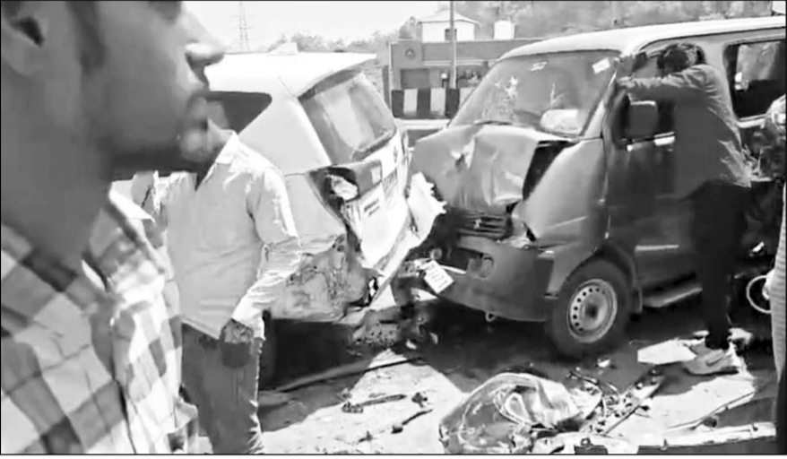
हादसे के बाद मौके पर पहुंचे लोगों ने घायलों को गाड़ियों से निकाला।

बताया जा रहा है कि हादसे में कई लोग घायल हुए हैं, बाइक सवार युवक भी गंभीर घायल, नौ लोग हॉस्पिटल में भर्ती