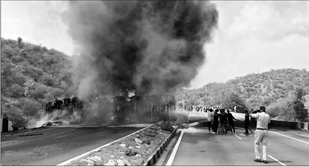
केमिकल से भरे टैंकर में भीषण आग लगने के बाद पांच दमकलों की टीम मौके पर पहुंची और आग पर काबू पाया।

राजसमंद, (निर्स)। जिले के दिवेर थाना क्षेत्र के छापली घाट में फोरलेन सड़क पर केमिकल से भरा टैंकर अनियंत्रित होकर पलटा गया और टैंकर में भीषण आग लग गई। घटना के बाद फोरलेन पर वाहनों की लंबी कतारें लग गईं। वहीं सूचना पर दिवेर