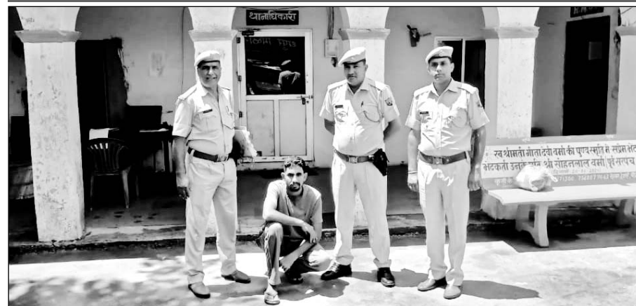
बबाई पुलिस ने फायरिंग के मामले में फरार चल रहे आरोपी को गिरफ्तार किया।

50 हजार का इनामी एक साल से फरार चल रहा था