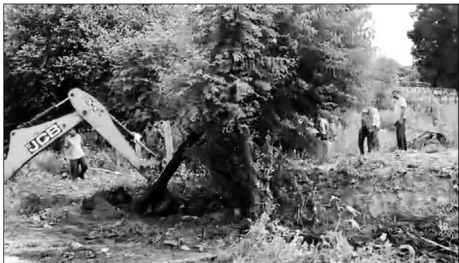
प्रशासन ने अतिक्रमण हटाने के नाम पर हरे पेड़ को जड़ से उखाड़ दिया।

चौमू/कालाडैरा, (निर्स)। एक पैड़ मां के नाम अभियान, जहां देश के प्रधानमंत्री नरेन्द्र मोदी के पहल पर राज्य सरकार चल रहा है। वहीं चौमू उपखण्ड के गांव कालाडैरा में शुक्रवार को तहसील प्रशासन के माध्यम से सम्पूर्ण हरे पेड़ को अतिक्रमण हटाने के नाम पर जड़ से उखाड़ दिया गया।