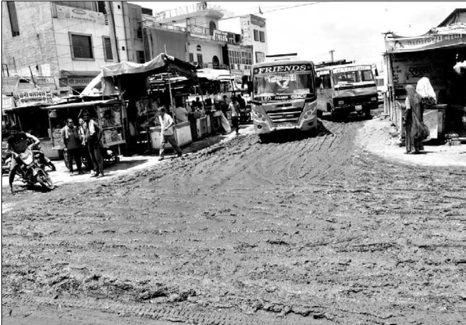
चूरू के पुराना बस स्टैंड पर बारिश के बाद जमा कीचड़ से लोगों को काफी परेशानी उठानी पड़ रही है।

में आती व जाती रहती है। वहां पर रोज हजारों सवारियों का आवागमन होता है। वहां पर चारों ओर कीचड़ इस कदर फैला हुआ है कि पैदल चल पाना मुश्किल हो रहा है। शहर के निचले इलाके बारिश के पानी से पूरी तरह भरे हुए हैं। जहां पर लोगों का अपने घरों से बाहर निकल पाना मुश्किल हो रहा है। बारिश का पानी नालियों से होकर सड़क पर गलियों में भर जाता है। जिसके कारण आमजन को काफी परेशानी हो रही है।