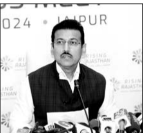
डूइंग बिजनेस' के तहत व्यवसाय करने की लागत में कमी लाना और लावलफोताशाही को कम करने का निरंतर प्रयास कर रही है, ताकि उद्योग जगत को प्रदेश में काम करने में आसानी हो।

जयपुर। मुख्यमंत्री भजन लाल शर्मा के नेतृत्व में इस वर्ष दिसंबर में जयपुर में आयोजित होने वाले 'राइजिंग राजस्थान' ग्लोबल इन्वेस्टमेंट समिट 2024 से पहले उद्योग एवं वाणिज्य मंत्री कर्नल राज्यवर्धन राठौड़ ने आज मीडिया को संबोधित किया। आज आयोजित प्रेस कॉन्फ्रेंस में माननीय मंत्री कर्नल राठौड़ ने कहा कि सरकार अगले पांच वर्षों में राज्य के सकल घरेलू उत्पाद को मौजूदा 15 लाख करोड़ रुपये से दोगुना करके 30 लाख करोड़ रुपये तक पहुंचाने का लक्ष्य लेकर चल रही है और 'राइजिंग राजस्थान' ग्लोबल इन्वेस्टमेंट समिट 2024 के जरिए प्रदेश में निवेश जुटाना सरकार की सर्वोच्च प्राथमिकता है। कर्नल राठौड़ ने यह भी कहा कि सरकार 'इज ऑफ