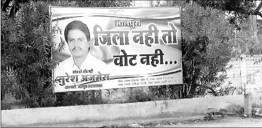
मालपुरा को जिला बनाने की मांग को लेकर शहर में लगे पोस्टर।

धरना स्थल पर बैठे धरनाधियों ने जिला बनाने की मांग को लेकर जेल भरो आंदोलन सहित अनेक गांधीवादी आंदोलनों के जरिए ज्ञापन सौंप सम्पूर्ण विधानसभा क्षेत्र के