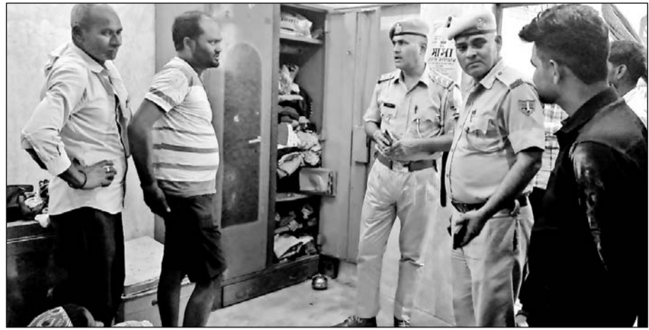
घटना की जानकारी मिलते ही निहालगंज पुलिस ने मौका-मुआयना कर चोरों की तलाश शुरू कर दी है।

धौलपुर, (निसं)। धौलपुर शहर में चोरों ने ओडेला रोड पर दो मकानों में घुसकर चोरी की वारदात को अंजाम दिया है। करीब 1 किलोमीटर के फासले पर बने दोनों मकान से चोर 20 हजार की नगदी के साथ 9 लाख रुपए के गहने पार कर ले गए घटना की जानकारी मिलते ही निहालगंज पुलिस ने मौका मुआयना कर चोरों की तलाश शुरू कर दी है।