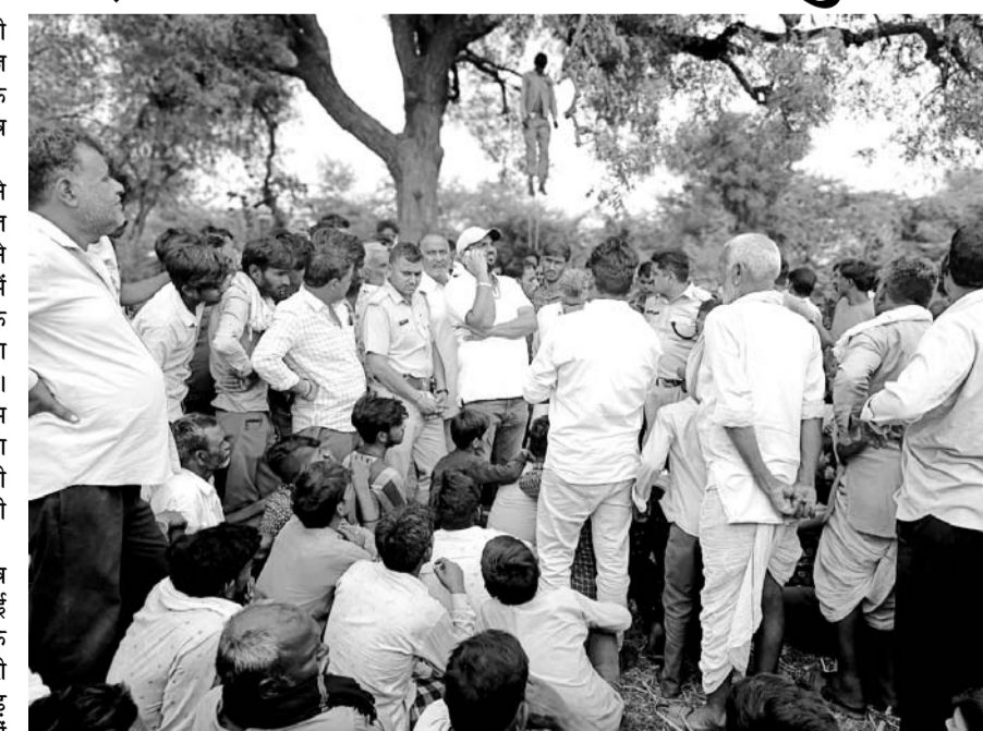
सूचना के बाद घटनास्थल पर लोगों की भीड़ जमा हो गई।

थाना प्रभारी ने बताया कि शव जमीन से करीब 20 फीट की ऊंचाई पर लटका हुआ था। एक रस्सी उसके गले व पेड़ से बंधी है, जबकि दूसरी रस्सी मृतक के सोने और नीम के पेड़ के मोटे भाग पर बंधी थी। इतना ही नहीं उसके पैर भी रस्सी से बंधे हुई थी। ऐसे में मौके पर पहुंचे मृतक के परिजनों के साथ ही ग्रामीणों ने युवक की मौत को हत्या बताते हुये त्वरित जांच की मांग