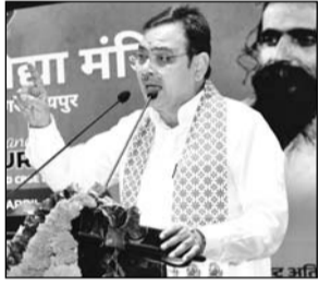
मुख्यमंत्री भजनलाल शर्मा

जयपुर। मुख्यमंत्री भजनलाल शर्मा ने कहा कि स्कूल ही विद्यार्थियों में संस्कार के बीज बोते हैं। शिक्षक विद्यार्थियों के जीवन में विद्या दान देकर उन्हें मजबूत बनाते हैं और आगे बढ़ने के लिए प्रेरित करते हैं। उन्होंने कहा कि आदर्श विद्या मंदिर संस्थान केवल एक विद्यालय नहीं, बल्कि समाज में निस्वार्थ सेवा, सहयोग और करुणा भी भावना का विस्तार कर रही है। बच्चों में संस्कार के साथ यह विद्यालय नैतिक मूल्यों एवं संस्कारों पर बल देता है। शर्मा बुधवार को आदर्श विद्या मंदिर विद्यालय, राजापार्क में बहुउद्देशीय सभागार के लोकार्पण समारोह को संबोधित कर रहे थे। उन्होंने नवीन सभागार के लिए विद्यालय प्रबंधन समिति, शिक्षकों और भामाशाहों को बधाई देते हुए कहा कि यह सभागार उन हजारों सपनों की नींव पर खड़ा हुआ है, जो इस विद्यालय के