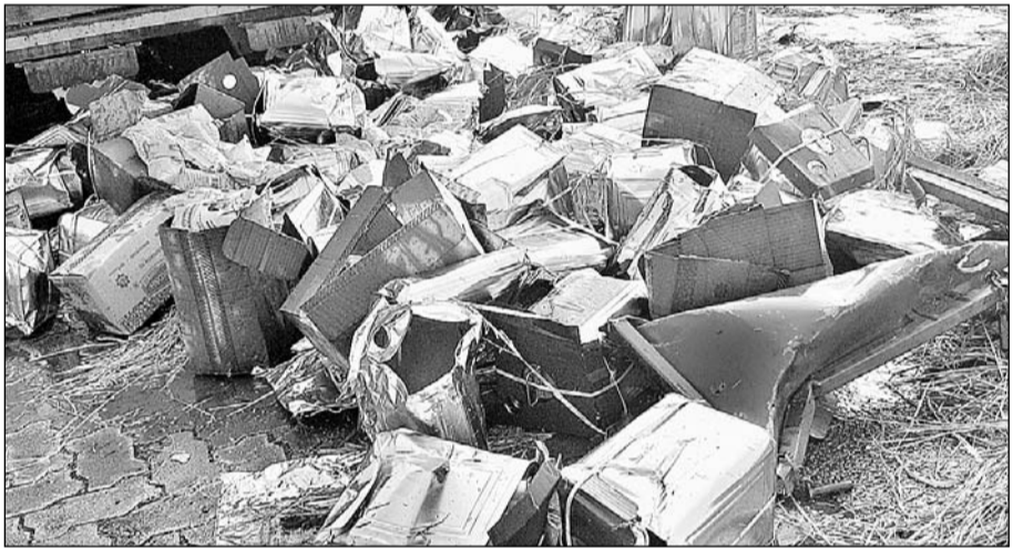
राष्ट्रीय राजमार्ग पर हादसे के बाद सड़क पर बिखरे तेल के पीपे

सुजानगढ़, (नि.सं)। मंगलवार सुबह राष्ट्रीय राजमार्ग पर दो ट्रेलर व ऊंट गाड़े की टक्कर में ऊंट गाड़ा सवार दो जने घायल हो गए। हाईवे पैट्रोलिंग के कुलदीप चरण ने बताया कि उरडा बस स्टैंड के पास मंगलवार सुबह पांच बजे एक खाली ट्रेलर आरजे 14 जीएल 9523 राजगढ़ से नागौर जा रहा था, के चालक को नींद की झपकी आने से आगे चल रहे ऊंट गाड़ा से ट्रेलर टकरा गया।