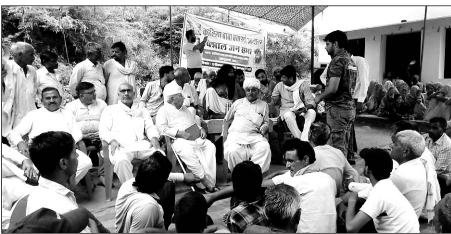
कालिया बाबा काला पहाड़ को खनन से बचाने और इसे धार्मिक क्षेत्र घोषित करने की मांग को लेकर चल रहे आन्दोलन में कई जनप्रतिनिधियों ने शिरकत की।

लोगों ने कहा कि सभी लीजों को समाप्त कराने के लिये आन्दोलन जारी रहेगा। इस पर्वत की गुफाओं में अनेकानेक संत-महात्मा तपस्या करते हैं और संत भक्तों द्वारा अनवरत