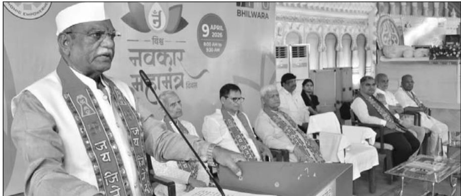
राज्यपाल बागड़े ने भीलवाड़ा में आयोजित विश्व नवकार महामंत्र दिवस समारोह को संबोधित किया।

इस दौरान राज्यपाल बागड़े ने कहा कि नवकार महामंत्र विश्व के प्राचीनतम एवं पावन मंत्रों में से एक है, जो अहिंसा, अपरिग्रह एवं अनेकतावाद जैसे सिद्धांतों पर आधारित है। यह मंत्र न केवल आध्यात्मिक उन्नति का मार्ग प्रशस्त करता है, बल्कि समाज में शांति, समृद्धि एवं सुशांति का भी संदेश देता है। वर्तमान वैश्विक परिस्थितियों में इसकी प्रासंगिकता और भी अधिक बढ़ गई है। राज्यपाल बागड़े ने जैन धर्म की महान परंपरा का उल्लेख करते हुए कहा कि