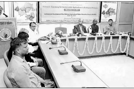
प्राकृतिक खेती पर दो दिवसीय प्रशिक्षण आयोजित हुआ।