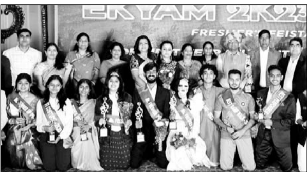
गिट्स में फ्रेशर पार्टी आयोजित हुई।

उदयपुर, (कासं)। गीतांजली इन्स्टिट्यूट ऑफ टेक्निकल स्टडीज डबोकउदयपुर में बॉटिंग ए बी सी ए एम सी ए एवं एटू ए बी ओ ए प्रथम वर्ष सत्र 2023-24 के विद्यार्थियों की फ्रेशर पार्टी का आयोजन द्वितीय वर्ष के विद्यार्थियों द्वारा किया गया। जिसमें सभी विभाग के विद्यार्थियों ने उत्साहपूर्वक भाग लेकर कार्यक्रम का आनन्द उठाया।