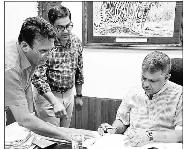
चिकित्सा एवं स्वास्थ्य मंत्री गजेन्द्र सिंह खींवर ने बुधवार को महिला स्वास्थ्य कार्यकर्ताओं के 3671 पदों पर अंतिम वरीयता सूची के लिये मंजूरी दी।

जयपुर। चिकित्सा एवं स्वास्थ्य मंत्री गजेन्द्र सिंह खींवर की पहल पर चिकित्सा एवं स्वास्थ्य विभाग में भर्तियों के काम को मिशन मोड में अंजाम दिया जा रहा है। इसी कड़ी में चिकित्सा मंत्री की मंजूरी के बाद बुधवार को महिला स्वास्थ्य कार्यकर्ताओं के 3671 पदों पर अंतिम वरीयता सूची जारी की गई। इन महिला स्वास्थ्य कार्यकर्ताओं का जल्द पदस्थापन होने से गांव-ढाणी तक स्वास्थ्य सेवाओं को और मजबूती मिलेगी।