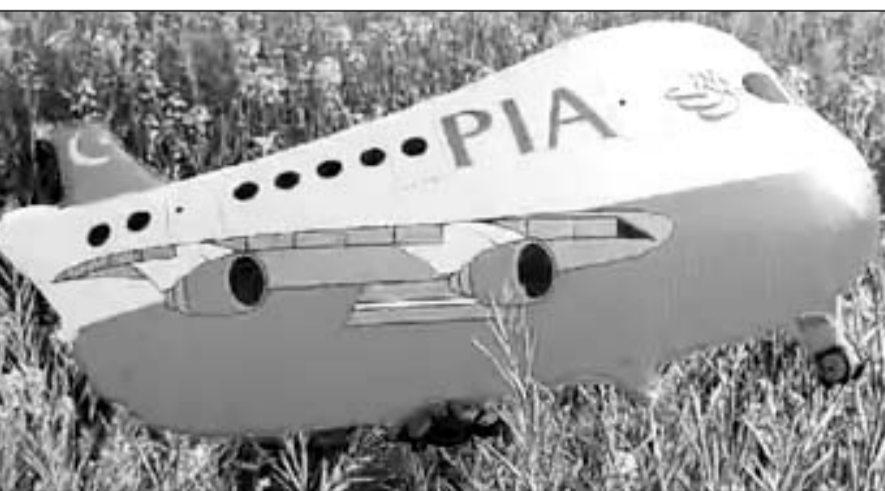
भारत-पाकिस्तान बॉर्डर के पास स्थित गांव में एक बार फिर पाकिस्तानी गुब्बारा मिला।

■ सूचना के बाद बीएसएफ जी ब्रांच और सीआईडी के अधिकारी मौके पर पहुंचे