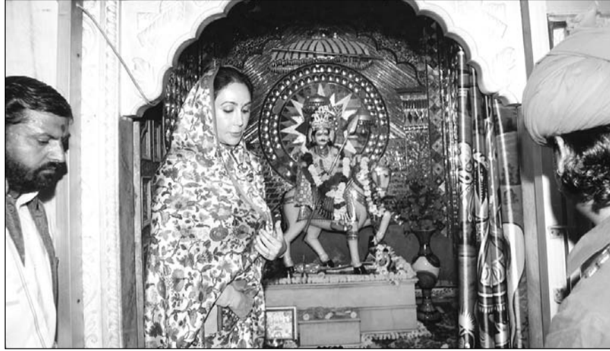
उपमुख्यमंत्री दिया कुमारी ने सर्वाहोत्र में भगवान श्री देवनारायण जी के दर्शन किये।

उपमुख्यमंत्री ने प्रेमसागर सरोवर के सौंदर्यीकरण, लाइट डेकोरेशन के कार्य व देवनारायण आवासीय बालिका विद्यालय खोलने की घोषणा की