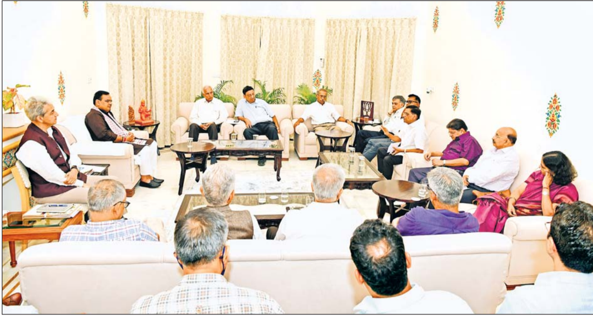
मुख्यमंत्री भजनलाल ने राइजिंग राजस्थान ग्लोबल इन्वेस्टमेंट समिट के संबंध में भारतीय प्रशासनिक सेवा एवं भारतीय पुलिस सेवा के सेवानिवृत्त अधिकारियों से चर्चा की।