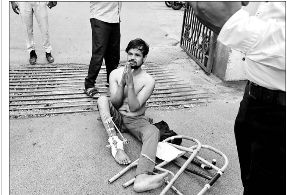
सुभाष नगर थाना क्षेत्र में रहने वाले एक युवक ने न्याय की मांग को लेकर कलेक्ट्री गेट पर हंगामा किया।

युवक ने न्याय की मांग को लेकर भीलवाड़ा कलेक्ट्री गेट पर हंगामा खड़ा किया