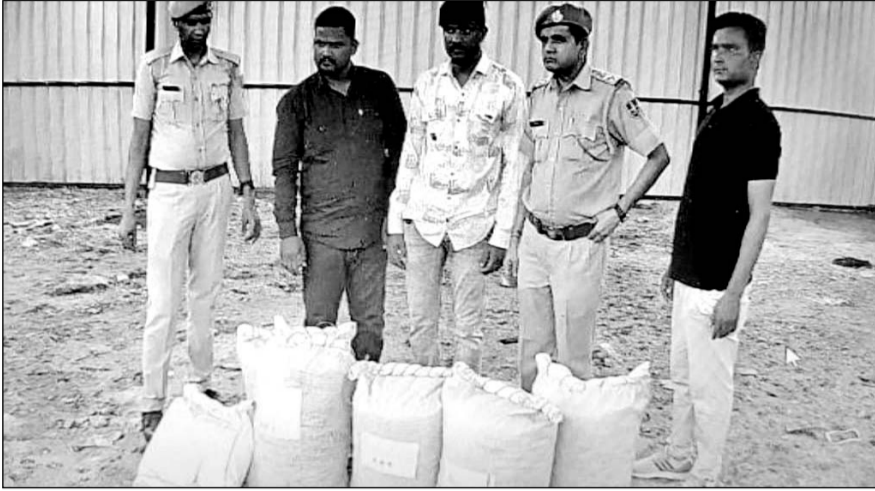
अवैध गांजा व डोडा-चूरा के साथ दो युवकों को गिरफ्तार किया।