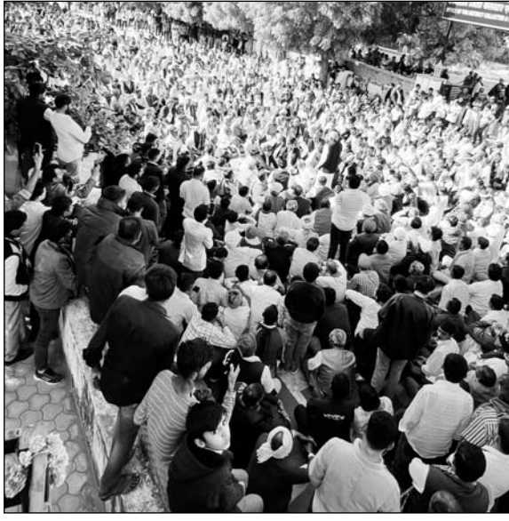
सांचौर जिला निरस्त होने के विरोध में उमड़ा जनाक्रोश।