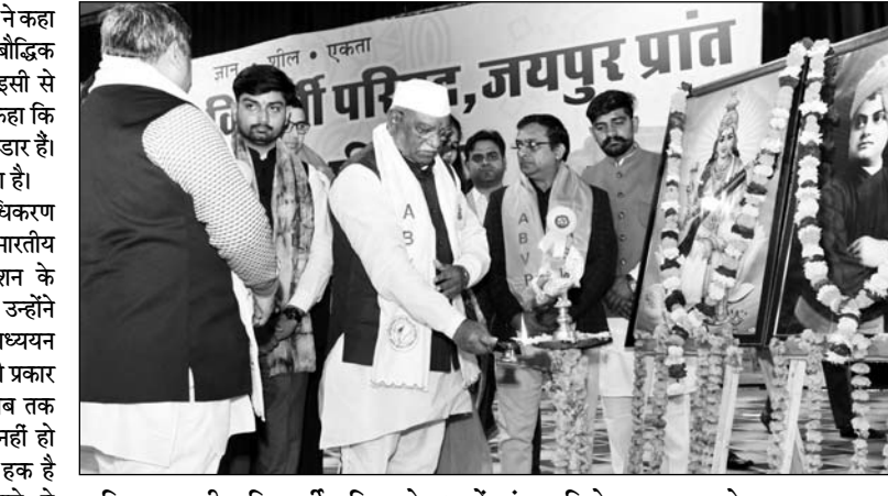
अखिल भारतीय विद्यार्थी परिषद के 60 वें प्रांत अधिवेशन का आयोजन हुआ।

भरतपुर, (निर्स)। राज्यपाल हरिभाऊ बागडे ने कहा कि विद्यार्थी किताबी ज्ञान के साथ-साथ बौद्धिक क्षमता बढ़ाने के लिए निरंतर प्रयास करें। इसी से उसका सर्वांगीण विकास संभव है। उन्होंने कहा कि भारतीय इतिहास एवं प्राचीन टांश ज्ञान के भंडार हैं। इससे आज का युवा बहुत कुछ सीख सकता है। बागडे सोमवार को भरतपुर विकास प्राधिकरण के ओडिटोरियम में आयोजित अखिल भारतीय विद्यार्थी परिषद के 60 वें प्रांत अधिवेशन के उद्घाटन समारोह को संबोधित कर रहे थे। उन्होंने कहा कि सभी विद्यार्थी शिक्षण संस्थानों में अध्ययन के दौरान ध्यान लगाकर अध्ययन करें, किसी प्रकार की शंका-संकोच के लिये अध्यापक से जब तक सवाल करें तब तक आपके जवाब प्राप्त नहीं हो जाते। उन्होंने कहा कि शिक्षा लेना आपका हक है और सिखाना अध्यापक का कर्तव्य है। बागडे ने कहा कि विद्यार्थी अपनी बौद्धिक शक्ति, गुणों, कौशल, नम्रता व संस्कारों से एक उजाले के जैसे चमककर अपनी प्रतिभा दिखाएँ। उन्होंने कहा कि विद्यार्थी महज किताबों के ज्ञान अर्जन या सर्टिफिकेट व डिग्री पर आश्रित न रहें, बौद्धिक क्षमता का विकास कर व्यवहारिक गुणों के साथ आगे बढ़ें। उन्होंने कहा कि विद्यार्थी संगठन अपनी शक्ति का विकास कर