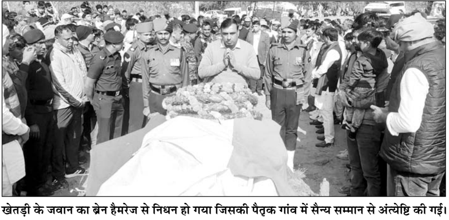
खेतड़ी के जवान का ब्रेन हैमरेज से निधन हो गया जिसकी पैतृक गांव में सैन्य सम्मान से अंत्येष्टि की गई।