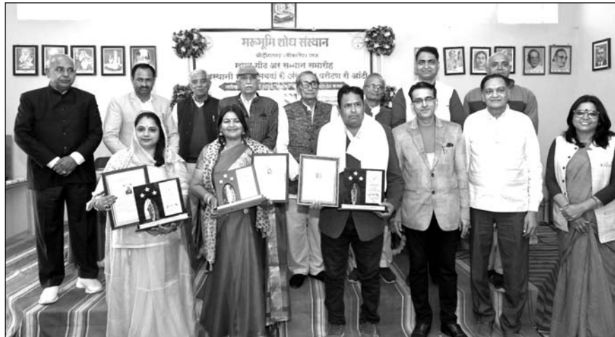
कार्यक्रम में साहित्यकारों व कवियों को सम्मानित किया गया।