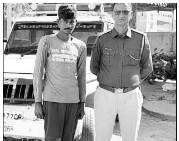
शराब के नशे में टोल कर्मचारियों से झगड़ा करने के आरोपी को गिरफ्तार किया।

■ धोलिया टोल नाका कर्मचारियों के साथ शराब के नशे में झगड़ा किया था