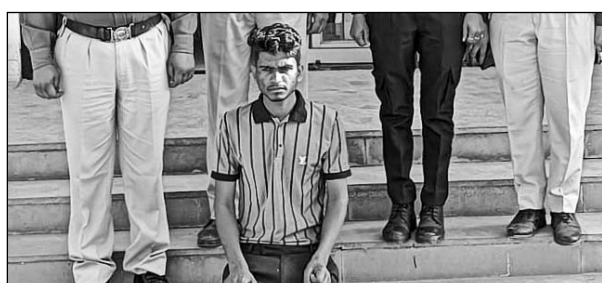
पुलिस ने दुष्कर्म के आरोपी को पकड़ा।

सांभरझील, (निसं)। युवती की अश्लील फोटो व वीडियो वायरल करने की धमकियां देकर दुष्कर्म करने के मामले में आरोपी को स्थानीय पुलिस ने गिरफ्तार किया। आरोपी घटना को अंजाम देने के बाद फरार हो गया था जिसे पुलिस ने महज 15 घंटे के अंतराल में ही दबोच लिया।