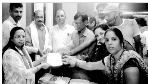
नागरिक अधिकार मोर्चा के कार्यकर्ताओं ने जिला कलेक्टर को ज्ञापन सौंपा।

ज्ञापिका के अनुसार जिले में बजरी का टेका नहीं होने के बावजूद भी खनिज विभाग पूर्व के टेकेदारों की मदद से अवैध खनन भारी मात्रा में करवा रहे हैं। खनिज विभाग द्वारा बजरी एवं खनन माफिया से मिलकर हमेशा करोड़ों रुपय के राजस्व का नुकसान किया जा रहा है। खनिज विभाग में प्रशासन की मिलीभगत से अवैध बजरी दोहन परिवहन से राजस्व को नुकसान