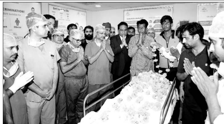
गीतांजली मैडिकल कॉलेज एवं हॉस्पिटल में हुआ केडेवेरिक अंगदान।

डॉक्टरों की टीम द्वारा परिवार वालों को अंगदान करने की सलाह दी गयी। परिवार वालों ने मिलकर अंगदान करने का निर्णय लिया। गीतांजली हॉस्पिटल की टीम के साथ समन्वय बनाया गया। गीतांजली हॉस्पिटल में ऑर्गन ट्रांसप्लान्टेशन की