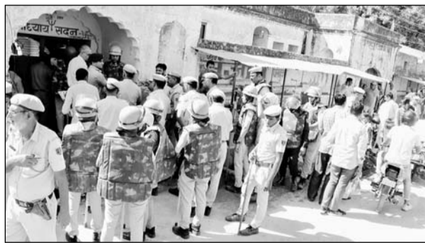
चुरू में मंत्रियों की छतरियों पर चालीस साल से चल रहे अतिक्रमण को न्यायालय के आदेश पर प्रशासन ने हटाया।

चुरू, (कास)। न्यायालय के आदेश से मंत्रियों की छतरियों में पिछले चालीस सालों काबिज किरायेदारों को जिला प्रशासन में बेदखल किया। चुरू जिला मुख्यालय पर झारिया मोरी स्थित मंत्रियों की छतरियों के नाम से स्थित दुकानदारों को व सार्वजनिक बाड़ों पर दुकान और पकान बनाकर निवास करने वाले दो दर्जन से अधिक परिवारों को नगर परिषद चुरू, पुलिस जाप्ता व