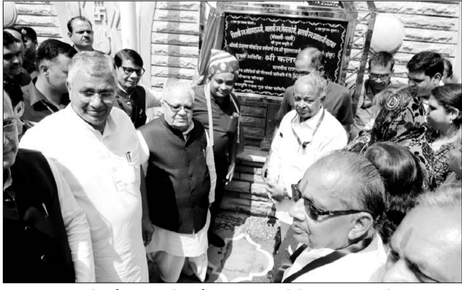
राज्यपाल कलराज मिश्र ने रूप रजत विहार में वाचनालय व अधितिगृह का उद्घाटन किया।

पाली, (निसं)। राज्यपाल श्री कलराज मिश्र ने कहा कि भारतीय संस्कृति और समाज में गुरु और गाय का स्थान अत्यंत महत्वपूर्ण है। गाय भारतीय संस्कृति में पुरानी है। भारत में हमारा भगवान श्री कृष्ण और भगवान शंकर ने नन्दन और नन्दी को महत्व