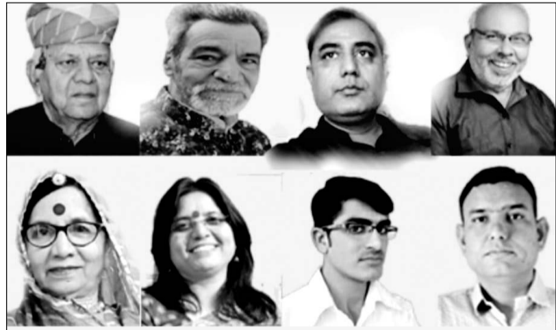
सम्मानित होने वाले साहित्यकार।