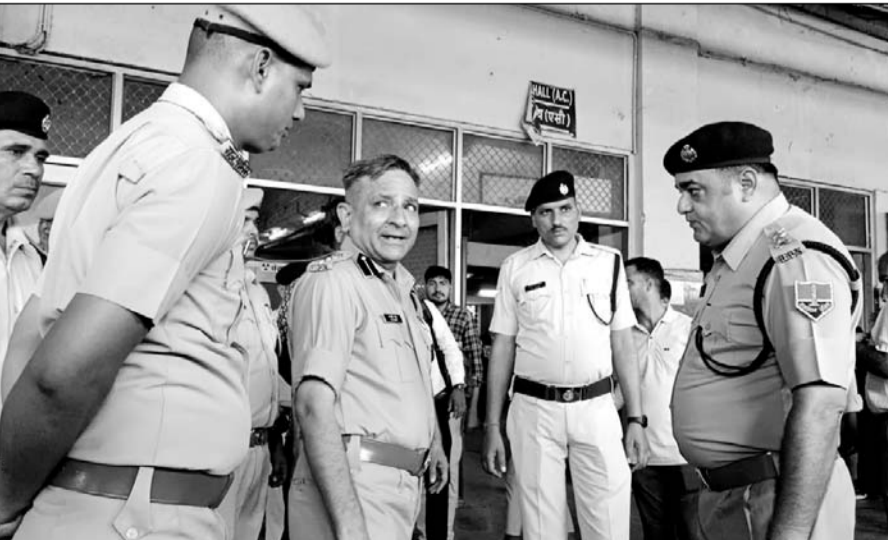
वारदात के बाद अजमेर रेलवे स्टेशन का जीआरपी एसपी ने मौका मुआयना किया।

अजमेर, (कासं)। अजमेर रेलवे स्टेशन पर मासूम बच्चियों के अपहरण और दुराचार को बरदास्त धमके का नाम नहीं ले रही है। मंगलवार देर रात ऐसा ही एक मामला सामने आया, जब अजमेर स्टेशन के प्लेटफार्म नंबर संख्या एक से 4 साल की मासूम बालिका अपहरण हो गया। बालिका का परिवार सिरोंही से दरगाह जियारत के लिए अजमेर आया था और गंतव्य स्थान पर जाने के लिए स्टेशन के प्लेटफार्म पर ट्रेन का इंतजार कर रहा था। घटना के बाद जीआरपी, आरपीएफ और रेलवे अधिकारियों ने तत्परता दिखाते हुए आरोपी को दस घंटे के अंदर अहमदाबाद के चांदोलिया रेलवे स्टेशन पर पोरबंदर एक्सप्रेस से गिरफ्तार कर लिया और बच्चों को सुरक्षित कब्जे में ले लिया। आरोपी को पुलिस टीम देर अजमेर लेकर आई।