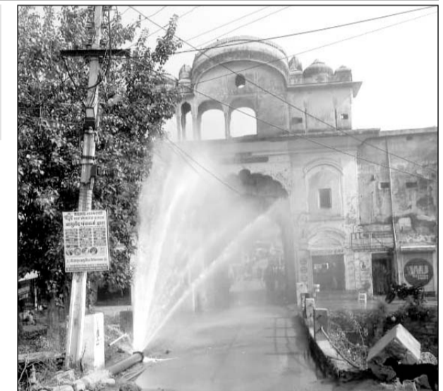
पानी सप्लाई शुरू होने पर ऊपर तक पानी का फव्वारा निकलता है।