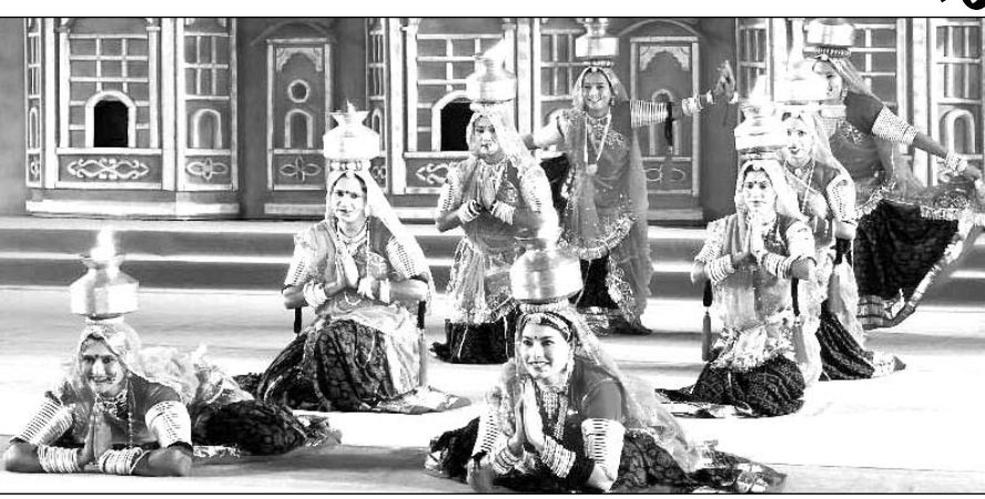
शिल्पग्राम महोत्सव में लोक कला संस्कृतियों में फोक डांस पर दर्शक झूम उठे।