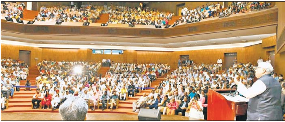
राजस्थान गौड़ ब्राह्मण महासभा की ओर से रविवार को बिड़ला ऑडिटोरियम में राष्ट्रीय ब्राह्मण सम्मेलन में राज्यपाल कलराज मिश्र ने संबोधित किया।

जयपुर, (का.सं.)। राजस्थान गौड़ ब्राह्मण महासभा की ओर से रविवार को बिड़ला ऑडिटोरियम में राष्ट्रीय ब्राह्मण सम्मेलन का आयोजन किया गया। इसमें देशभर के 15 प्रदेशों के प्रतिनिधि शामिल हुए। सभी ने ब्राह्मण समाज को एकजुट होकर काम करने की जरूरत जताई। सम्मेलन में समाज का विजन डायरेक्ट तैयार किया गया। इसके तहत विप्र बैंक और ब्राह्मण शिक्षा निधि कोष का गठन किया जाएगा। हर जिला व तहसील स्तर पर परशुराम लाइब्रेरी का गठन होगा।