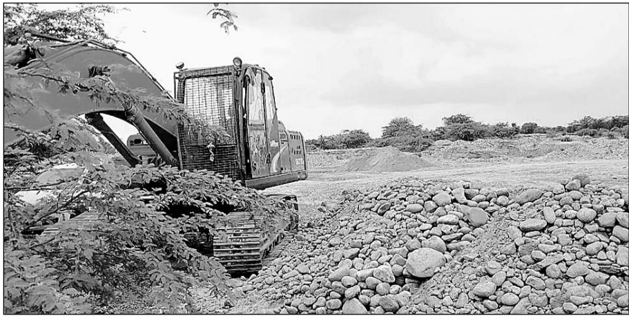
राजसमंद में जेसीबी की सहायता से अवैध खनन किया जा रहा है।