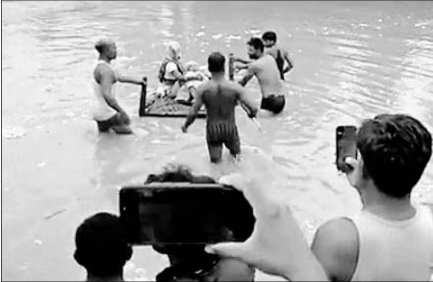
कछावन गांव में एक वृद्ध महिला के बीमार हो जाने पर ग्रामीणों ने खाट पर लिटाकर उफनते नाले को पार कराया।