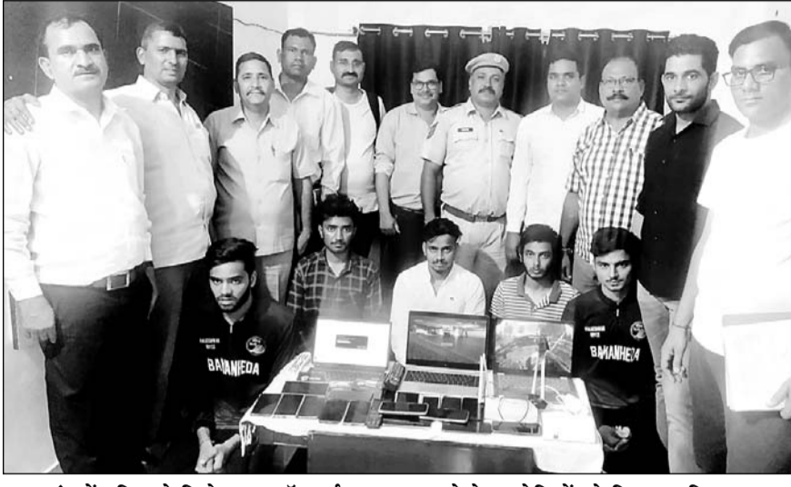
राजसमंद में पुलिस ने क्रिकेट पर ऑनलाईन सट्टा लगाने के आरोपियों को गिरफ्तार किया।