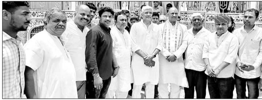
भाजपा प्रदेशाध्यक्ष सी पी जोशी, केंद्रीय जल शक्ति मंत्री गजेंद्र सिंह शेखावत का कार्यक्रमों में स्वागत एवं अभिनंदन किया।