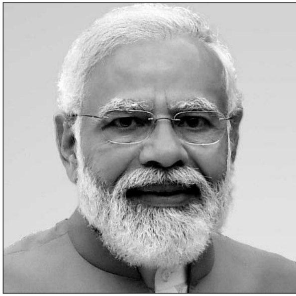
प्रधानमंत्री नरेन्द्र मोदी

महान समाज सुधारक महात्मा फुले का जीवन नैतिक साहस, आत्म चिंतन और समाज के हित के लिए अटूट समर्पण का प्रेरक उदाहरण है