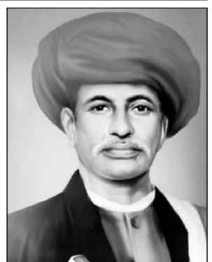
महात्मा ज्योतिबा फुले

ज्योतिबा फुले युग से आगे की सोच रखते थे, इसीलिए महिला