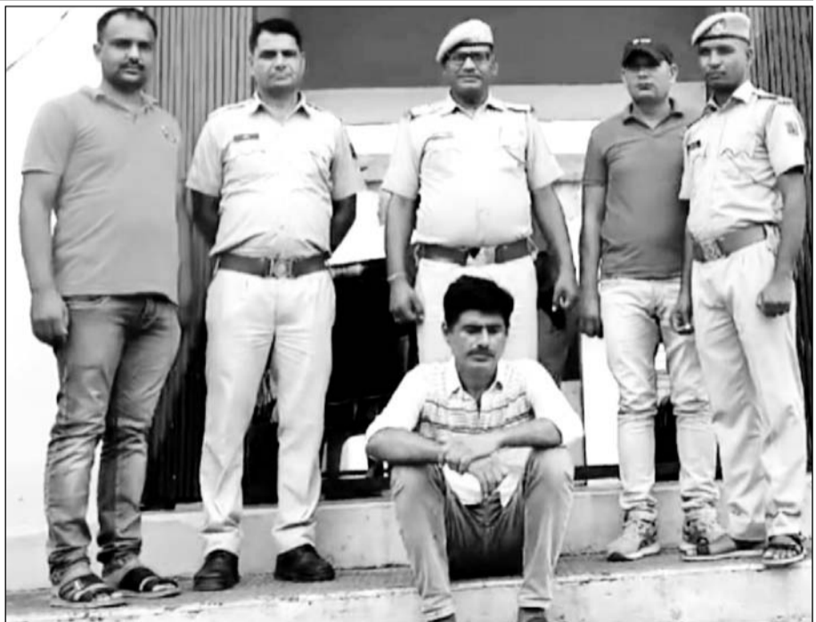
एंटी गैंगस्टर टास्क फोर्स की सूचना पर ब्यावर जिले में बर पुलिस ने तस्कर को गिरफ्तार किया।