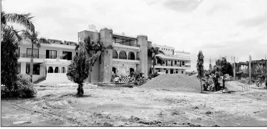
मांडलगढ़ के त्रिवेणी संगम पर रिसोर्ट की आड़ में सरकारी भूमि पर कब्जा कर अवैध निर्माण किया।

मांडलगढ़, (निर्स)। मांडलगढ़ के पास त्रिवेणी संगम की बनास नदी के तट पर एक प्रभावशाली शख्स द्वारा लाखों की कीमत की सरकारी जमीन पर अतिक्रमण रिसोर्ट निर्माण करने का मामला सामने आया है। इस मामले में राजस्व मंत्री के दखल के बाद भी राजस्व विभाग ने रिसोर्ट की भूमि से अवैध निर्माण को नहीं हटाया है। मांडलगढ़ तहसीलदार ने पटवारी की मौका रिपोर्ट पर कार्रवाई करते हुए अतिक्रम को नोटिस जारी किया है।