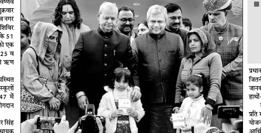
रेलवे मंत्री अश्विनी वैष्णव और नगरीय विकास मंत्री झाबर सिंह खर्वा ने दशरथा मैदान में आयोजित शिविर में सुकन्या योजना की लाभार्थी बच्चियों को बैंक वितरित किए।

जयपुर (कासं)। केंद्रीय रेल मंत्री अश्विनी वैष्णव और नगरीय विकास मंत्री झाबर सिंह खर्वा शुक्रवार को आदर्श नगर स्थित दशरथा मैदान में हैरिटेज नगर निगम के "विकसित भारत संकल्प यात्रा" शिविर में पहुंचे। जहां उन्होंने प्रधानमंत्री उज्ज्वला के 51 गैस चूल्हे, स्वनिधि के 1500 लाभार्थियों को एक करोड़ 70 लाख, जीवन ज्योति बीमा के 125 व सुकन्या समृद्धि योजना के 6 लाभार्थियों को ऋण वितरण पत्र व बैंक बांटे।