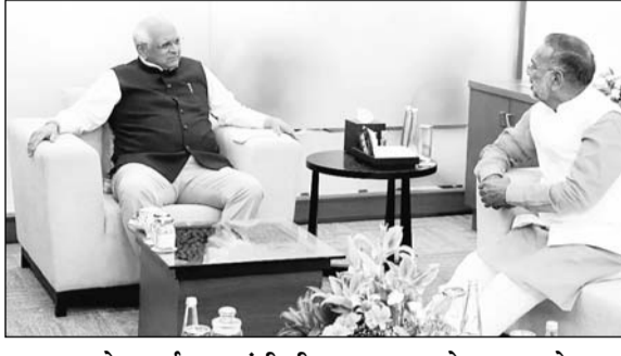
राजस्थान के ऊर्जा राज्यमंत्री हीरालाल नागर ने गुरुवार देर रात गांधीनगर में गुजरात के मुख्यमंत्री भूपेन्द्र पटेल से मुलाकात की।

जयपुर (कासं)। राजस्थान ऊर्जा के क्षेत्र में गुजरात की विशेषज्ञताओं का लाभ उठाएगा। इसके लिए अधिकारियों एवं विशेषज्ञों का एक दल जल्द ही गुजरात के दौरे पर भेजा जाएगा। यह दल एनर्जी सेक्टर में निवेश एवं उत्पादन को बढ़ावा देने वाली गुजरात सरकार की नीतियों का अध्ययन करेगा और राजस्थान के परिप्रेक्ष्य में इन्हें लागू करने की संभावनाओं को तलाशेगा।