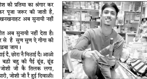
गणेश चतुर्थी पर काम आने वाले डंका दिखाता युवक।

पढबा की पढाई दे, छोरा ने मिटाई दे। आळो दूढ दिवाळो दूढ, बडी बहु की पैई दूढ, दूढ दूढाकर बारैआ, जोशी जी के तिलक लगा, लाडूडा मे पान सुपारी, जोशी जी रे हुई दिवाळी। जिणश जी नै तिलियौ दे, छोरा नै गुडधानी दे, ऊपर उंडो पाणी दे। एक विधा खोटी, दूजी पकडी चोटी। चोटी बोले धम धम, विधा आवे झम झम