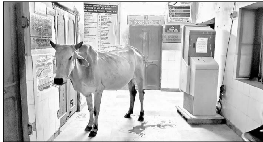
नारायणपुर अस्पताल परिसर में चिकित्सक कक्ष के सामने खड़ी गाय।

(एमआरएस) की मिटिंग में मंत्री द्वारा मरीजों के लिए अस्पताल में सुविधाओं को लेकर बड़े-बड़े दावे किये जा रहे