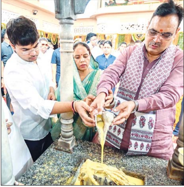
मुख्यमंत्री भजनलाल शर्मा ने मंगलवार को गिरिराज धरण की परिक्रमा संपन्न की और डीग में पंचोत्री का लौटा स्थित श्रीनाथ जी के दर्शन किए।

इसके पश्चात, मुख्यमंत्री ने श्रीनाथ जी मंदिर परिसर में उपस्थित संतों, स्थानीय नागरिकों और दूर-दराज से आए श्रद्धालुओं को अपने हाथों से प्रसादी वितरित की। उन्होंने इस दौरान श्रद्धालुओं से आत्मीय संवाद कर यात्रा के दौरान मिल रही सुविधाओं के संबंध में जानकारी ली। उल्लेखनीय है कि मुख्यमंत्री ने सोमवार शाम को सप्तकोसी परिक्रमा प्रारंभ की थी, जो