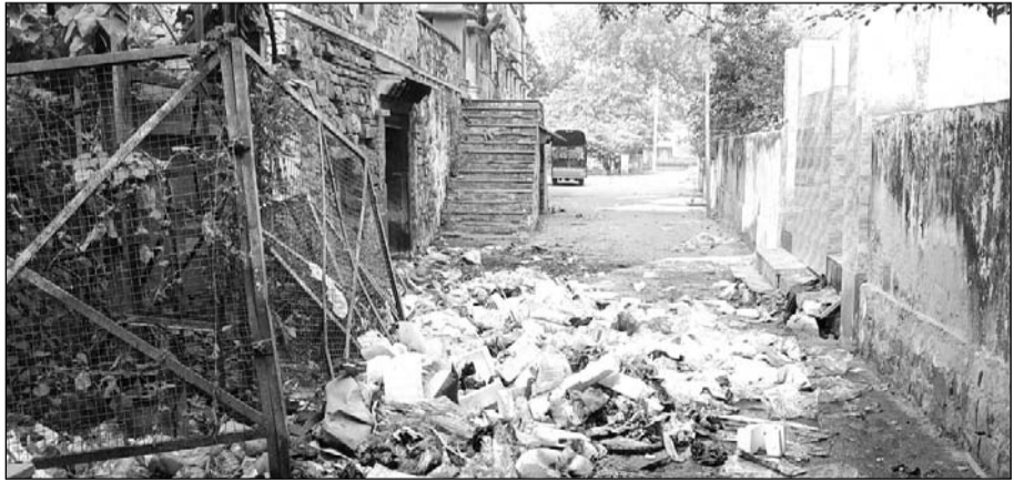
रेडक्रॉस कार्यालय के पास बना कूड़े मल मूत्र गंदगी के ढेर।

भरतपुर (नि.स.)। नगर निगम की बड़ईतजामों कुछ लोगों के लिए भारी परेशानी का सबब बनी हुई है। शहर के मोरी चार बाग स्थित रेडक्रॉस