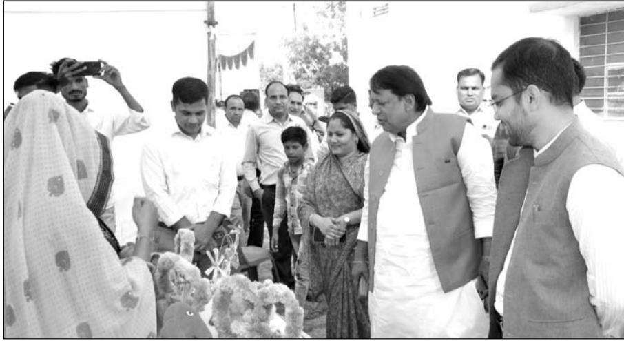
गंगापुर सिटी में कार्यक्रम में मौजूद एवं प्रदर्शनी का अवलोकन करते प्रशासनिक अधिकारी व जन प्रतिनिधि।