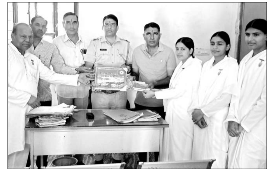
दूदू में प्रजापिता ब्रहमकुमारी विश्वविद्यालय की बहनों ने सोमवार को पुलिस थाना कर्मियों के राखी बांध कर ओमशांति का प्रतीक चिह्न भेंट किया। इस अवसर पर बहिनें एवं पुलिस कर्मी मौजूद रहें।