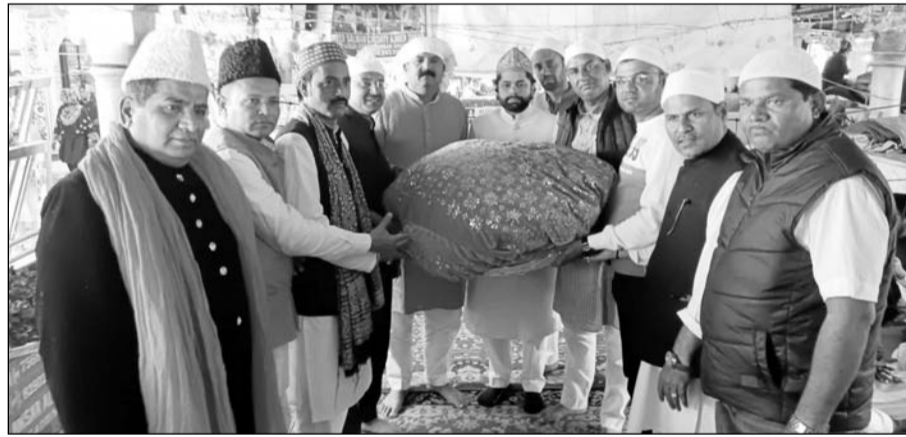
ख्वाजा मोइनुद्दीन हसन चिश्ती के उर्स के मौके पर वसुंधरा राजे की ओर से भेजी गई चादर पेश की।