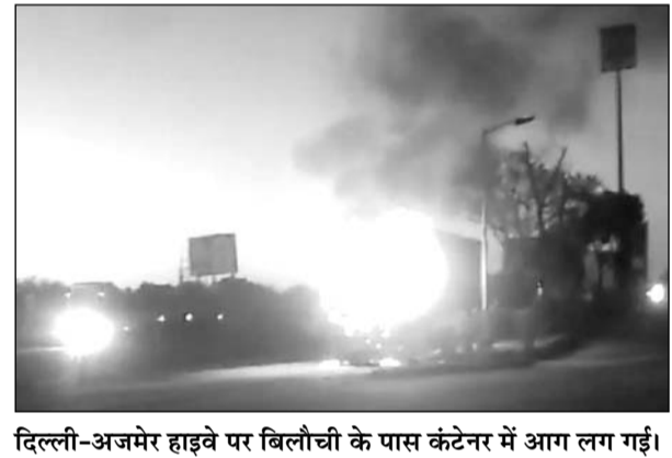
दिल्ली-अजमेर हाइवे पर बिलौची के पास कन्टेनर में आग लग गई।