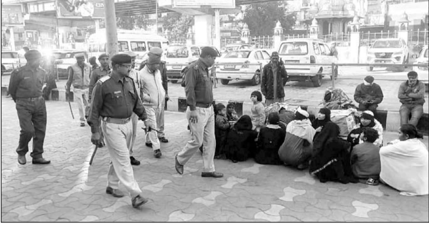
उत्तर-पश्चिम रेलवे सुरक्षा बल अजमेर मंडल द्वारा रेलवे स्टेशन अजमेर की सुरक्षा व्यवस्था के माकूल इंतजाम किये गये हैं।

अजमेर, (कास)। उत्तर-पश्चिम रेलवे सुरक्षा बल अजमेर मंडल द्वारा ख्वाजा मोइनुद्दीन हसन चिश्ती की दरगाह के 813वें उर्स के मद्देनजर रेलवे स्टेशन अजमेर की सुरक्षा व्यवस्था के माकूल इंतजाम किये गये हैं। रेलवे स्टेशन पर रेलवे सुरक्षा बल थाना अजमेर द्वारा 260 अधिकारी, स्टाफ को तैनाती की गई है। पूरे अजमेर स्टेशन पर निगरानी के लिए 123 सीसीटीवी कैमरे स्थापित हैं तथा दौरा एवं मदार स्टेशनों पर भी 15-15 कैमरे स्थापित किये गये हैं, जिससे संदिग्ध व्यक्तियों की गतिविधियों पर सूक्ष्म निगरानी की जा रही है।