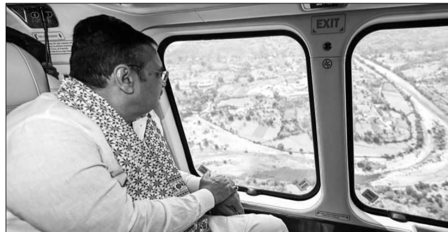
सीएम भजनलाल शर्मा ने देवास-3 एवं 4 पेयजल परियोजना का हवाई सर्वे किया।