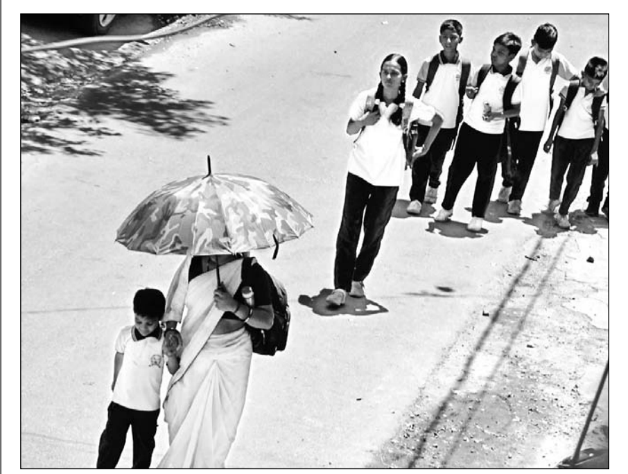
जिला कलैक्टर के आदेश हवा : भीषण गर्मी व तेज धूप के कारण जिला कलैक्टर ने सभी स्कूलों में छोटे बच्चों को राहत देते हुए साढ़े ग्यारह तक छुट्टी करने के आदेश दिये लेकिन निजी स्कूल आदेश को नज़र अंदाज़ कर बच्चों को तपती दोपहर में 12 बजे बाद घर जाने को भेज रहे।

ने इस हमले को अत्यंत निंदनीय करार देते हुए कहा कि निहत्थे पर्यटकों पर किया गया यह आतंकी हमला कायरता का प्रतीक है। उन्होंने कहा कि सरकार इस दुःखद घड़ी में शोक संतप्त परिजनों के साथ खड़ी है और उन्हें हरसंभव सहायता प्रदान की जाएगी।