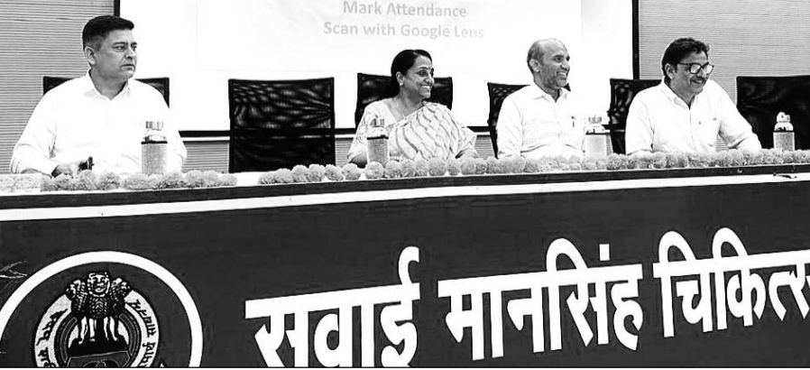
मुख्यमंत्री आयुष्मान आरोग्य योजना के सफलतापूर्वक संचालन एवं क्लेम की प्रक्रिया एवं भुगतान को सुगम बनाने के संबंध में सवाई मानसिंह मेडिकल कॉलेज के सभागार में बुधवार को प्रशिक्षण कार्यशाला का आयोजन किया गया।