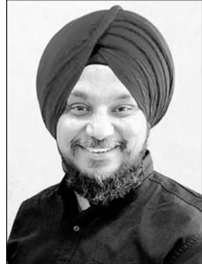
डॉक्टर पीएस कोहरा

सरकार के राजस्व घाटे की बात की जाए तो पिछले 3 वर्षों में यह लगातार बढ़ा है। जहां 18-19 में ये 31.07 प्रतिशत था तो अगले वित्तीय वर्ष में ये 31.64 प्रतिशत रहा। वित्तीय वर्ष 20-21 के संशोधित वित्तीय प्रस्तुतीकरण में इसे 41.36 प्रतिशत आंका गया था। राजस्व घाटे का कारण सरकार की वित्तीय आय में कमी है। 2020-21 के आकड़े इसे स्पष्ट भी करते हैं। करों के संग्रहण में उत्पादन शुल्क में 9 प्रतिशत की कमी संशोधित वित्तीय प्रस्तुतीकरण में रखी गई थी, वहीं पर राज्य के विक्रय कर वेट में 8 प्रतिशत की कमी थी। अर्थव्यवस्था के वित्तीय घाटे की बात की जाए तो वह भी पिछले 3 वर्षों में लगातार बढ़ा है।