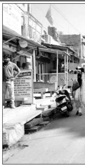
जैसलमेर सोनार दुर्ग की तीन माह पूर्व गिरी दीवार का मुख्य मार्ग, जहां पत्थर गिर गये।

जैसलमेर, (निर्सं)। पर्यटन मानचित्र में विश्व प्रसिद्ध सोनार किले का दीवार करने सालाना लाखों देशी विदेशी सेलानी आ रहे हैं। केंद्र, राज्य और स्थानीय प्रशासन को पर्यटकों के जरिये सालाना करोड़ों रुपये का राजस्व प्रदान हो रहा है। वर्ल्ड हेरिटेज की लिस्ट में शामिल जैसलमेर के 868 साल पुराने सोनार किले की दीवार से मंगलवार को 4 बड़े पत्थर अचानक सड़क पर आ गिरे। भारी पत्थरों के गिरने से वहां काम कर रहे दो मजदूरों ने भागकर जान बचाई। यही नहीं, पत्थरों के गिरने से बैरिकेड के साथ-साथ बीएसएनएल का पोल भी टूटकर सड़क पर गिर गया। अचानक हुए इस हादसे से लोग भयभीत हो गए। गंभीरत रहीं कि इस उस दौरान कोई वाहन या व्यक्ति सड़क से नहीं गुजरा, बरना बड़ा हादसा हो सकता था।