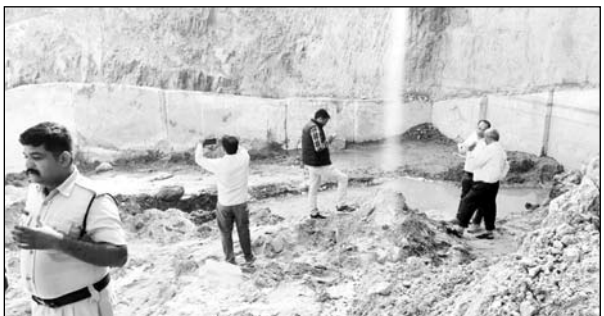
खनिज अभियंता चित्तौड़गढ़ के क्षेत्राधिकार में टीम ने कार्रवाई की।

उदयपुर, (कासं)। अतिरिक्त निदेशक माईस उदयपुर जोन दीपक तंवर के निर्देशन में खान विभाग की टीम ने चित्तौड़गढ़ के भूपालसागर के पारी गांव में अवैध खनन के खिलाफ बड़ी कार्रवाई की। टीम द्वारा खनिज क्वार्टज का मौके पर 16-16 टन वजन के दो ब्लॉक और एक्सकवेटेड माल पकड़ा गया। इसके साथ ही किए गए खनन का आंकलन करने पर 2592 टन अवैध खनन पाया गया। खनिज क्वार्टज की कीमत लगभग 50 हजार प्रति टन बताई जा रही है। इस तरह से करीब 6 करोड़ रुपये से अधिक के क्वार्टज खनन का अवैध खनन पाया गया है। अतिरिक्त निदेशक तंवर ने खनिज अभियंता चित्तौड़गढ़ को संबंधित के खिलाफ मामला दर्ज कराने के निर्देश दिए हैं। अतिरिक्त निदेशक दीपक तंवर को