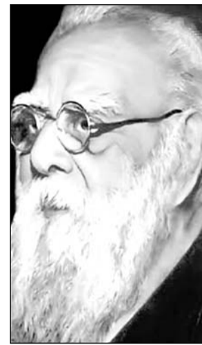
ई.वी. रामास्वामी पेरियार

■ ब्राह्मणों के निःशुल्क भोजन पंडाल से धक्का मारकर निकालने पर वे रूढ़िवादी हिन्दुत्व के घोर विरोधी हो गए