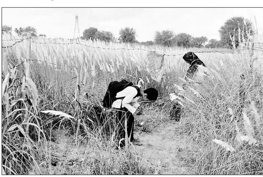
दलित परिवार के घर जाने का आम रास्ता जिसे कटीले तार लगाकर बंद कर दिया गया है।

स्कूल के शिक्षक एवं छात्र तथा पोषाहार एवं पानी की आपूर्ति पूरी तरह से वंचित हो रही है। इस ढाणी के लिए 23 वर्ष पूर्व सरकार ने राजकीय