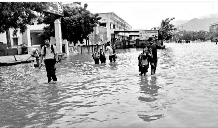
अजमेर में रेस्क्यू टीम ने छोटे बच्चों को कंधों पर बड़े बच्चों को रस्से के सहारे पानी में से बाहर निकाला।

अजमेर, (कासं)। अजमेर शहर में लगातार हो रही बारिश से स्मार्ट सिटी की पोल खोल कर रख दी है। शहर में शुक्रवार को स्थिति उस समय भयावह हो गई, जब मूसलाधार बरसात से बाढ़ जैसे हालात उत्पन्न हो गए। खासकर उन