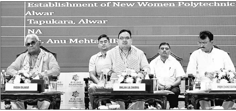
एजुकेशन प्री समिट कार्यक्रम में मुख्यमंत्री भजनलाल शर्मा, उप मुख्यमंत्री प्रेमचंद बैरवा, शिक्षा एवं पंचायती राज मंत्री मदन दिलावर, कौशल नियोजन उद्यमिता विभाग, युवा एवं खेल विभाग मंत्री कर्नल राज्यवर्धन सिंह राठौड़ मौजूद रहे।

जयपुरा कभी मरूपी के रूप में पहचान रखने वाला हमारा राजस्थान निरंतर प्रगति, समृद्धि और उन्नति के पथ पर निरंतर आगे बढ़ रहा है। राज्य के सामाजिक-आर्थिक विकास और जनता के हितोत्तरीय राइजिंग राजस्थान जैसा ऐतिहासिक एवं अभूतपूर्व आयोजन आयोजित होने जा रहा है। इसके पूर्व प्रदेश की शिक्षा में नवनिर्माण का मार्ग प्रशस्त करने, सकारात्मक परिवर्तन, राष्ट्रीय शिक्षा नीति के विभिन्न उद्देश्यों को साकार करने और शिक्षा के क्षेत्र में निवेश की दिशा में 6 नवंबर को होटल इंटरकॉन्टिनेंटल, टॉक रोड, जयपुर में एजुकेशन प्री-समित 2024 का आयोजन किया गया। उच्च शिक्षा, स्कूल शिक्षा, संस्कृत शिक्षा, तकनीकी शिक्षा, कौशल एवं उद्यमिता विभाग तथा खेल एवं युवा मामलात के संयुक्त तत्वावधान में आयोजित यह सम्मेलन न केवल शिक्षा क्षेत्र के भामाशाह, दानदाता, और हितधारकों को एक साथ लाएगा, बल्कि शिक्षा के भविष्य के विकास हेतु रणनीतियों और नवाचारों पर विचार-विमर्श का एक महत्वपूर्ण मंच भी प्रदान करेगा। कार्यक्रम में मुख्यमंत्री भजनलाल शर्मा, उप मुख्यमंत्री प्रेमचंद बैरवा, शिक्षा एवं पंचायती राज मंत्री मदन दिलावर, कौशल नियोजन उद्यमिता विभाग, युवा एवं खेल विभाग मंत्री कर्नल राज्यवर्धन सिंह राठौड़ मौजूद रहे।