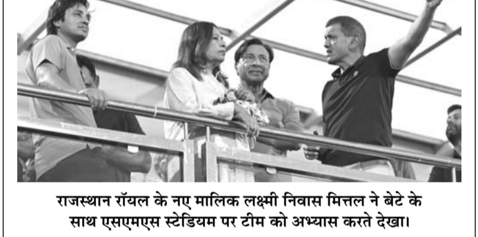
राजस्थान रॉयल के नए मालिक लक्ष्मी निवास मित्तल ने बेटे के साथ एसएमएस स्टेडियम पर टीम को अभ्यास करते देखा।