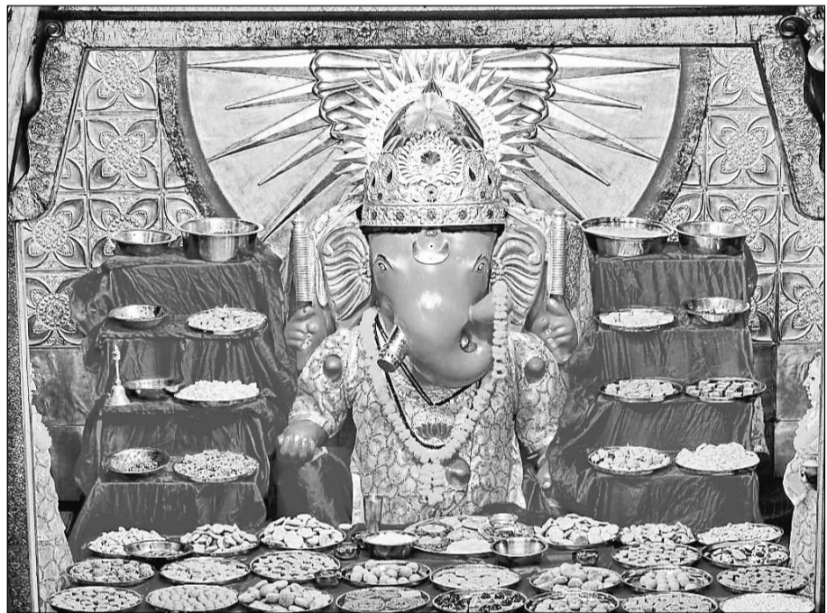
गणेश जन्मोत्सव समारोह के तहत दूसरे दिन रविवार को छप्पन भोग की झांकी सजाई।