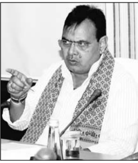
मुख्यमंत्री भजनलाल शर्मा

—कार्यालय संवाददाता— जयपुर। मुख्यमंत्री भजनलाल शर्मा के निर्देश पर पुलिस मुख्यालय से अतिरिक्त महानिदेशक (एडीजी) स्तर के वरिष्ठ पुलिस अधिकारियों को अपनी रैंज के पुलिस जिलों की विजिट के दौरान वहां कमजोर वर्गों, महिला व बच्चों के विरुद्ध अपराध एवं साइबर सुरक्षा से मामलों पर नियंत्रण के लिए किए जा रहे प्रयासों के साथ ही इनके पेंडिंग प्रकरणों की समीक्षा के लिए पाबंद किया गया है। इसके अलावा सभी रैंज प्रभारी एडीजी मादक पदार्थों से संबंधित मामलों की स्थिति एवं अन्य गंभीर प्रकृति के अपराधों पर नियंत्रण की समीक्षा कर पेंडिंग प्रकरणों के बारे में अपनी रिपोर्ट पुलिस मुख्यालय को प्रस्तुत करेंगे।