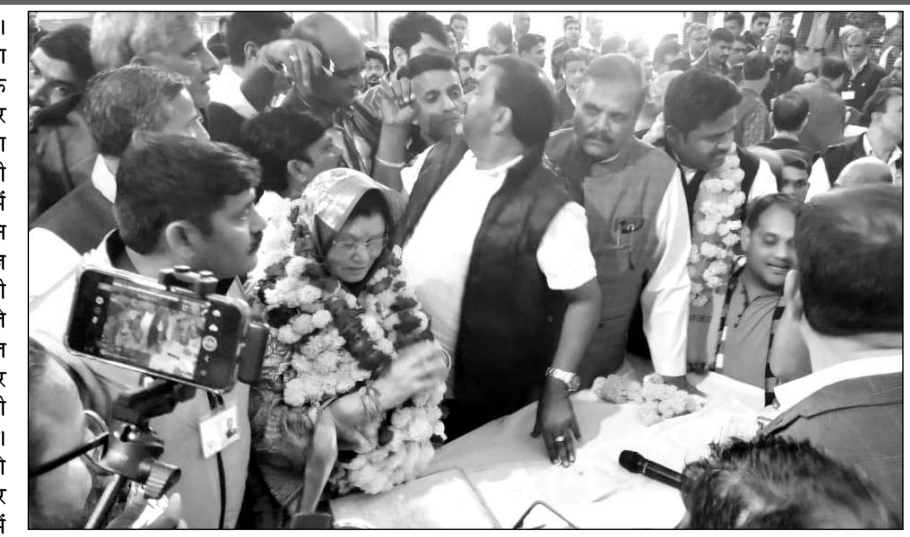
सलूमबर उपचुनाव की मतगणना के बाद विजयी प्रत्याशी की रिटर्निंग अधिकारी ने घोषणा की।

उल्लेखनीय है कि सलूमबर विधानसभा के 2023 में हुए चुनाव