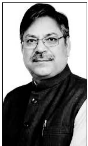
डॉ. सतीश पूनिया।

जयपुर। भाजपा हरियाणा प्रभारी एवं राजस्थान भाजपा पूर्व प्रदेश अध्यक्ष डॉ. सतीश पूनिया ने राजस्थान, महाराष्ट्र सहित तमाम राज्यों के विधानसभा चुनाव और उपचुनाव में भाजपा की ऐतिहासिक जीत पर कहा कि महाराष्ट्र विधानसभा चुनाव और राजस्थान समेत विभिन्न राज्यों के विधानसभा उपचुनावों में भाजपा की शानदार जीत यह दर्शाती है कि जनता ने भाजपा की नीतियों और प्रधानमंत्री नरेंद्र मोदी के कुशल नेतृत्व में चल रही डबल इंजन सरकारों पर अपना पूरा भरोसा जताया है। जनता ने कांग्रेस और उसके गठबंधन को उनकी धराशायी हो चुकी जमीन की स्थिति का आईना दिखा दिया है। भाजपा की इस सफलता ने यह साबित कर दिया है कि जनता को विकास, सुशासन और स्थिरता पर भरोसा है, जबकि कांग्रेस और उसके सहयोगी दलों की राजनीति को जनता ने नकार दिया है।