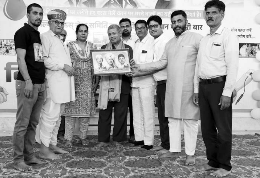
प्रसिद्ध क्रांतिकारी और देश के लिए अपने प्राणों का उत्सर्ग करने वाले भगत सिंह, राजगुरु व सुखदेव के बलिदान दिवस पर रक्तदान शिविर का आयोजन किया गया।

नागौर, (निसं)। प्रसिद्ध क्रांतिकारी और देश के लिए अपने प्राणों का उत्सर्ग करने वाले भगत सिंह, राजगुरु व सुखदेव के बलिदान दिवस पर रक्तदान शिविर का आयोजन किया गया। शिविर में 401 ब्लड यूनिट एकत्रित हुआ। उमदी युवा शक्ति द्वारा भारी संख्या में रक्तदान कर इन बलिदान प्रतापीयों के प्रति सच्ची श्रद्धांजलि प्रकट की गई।