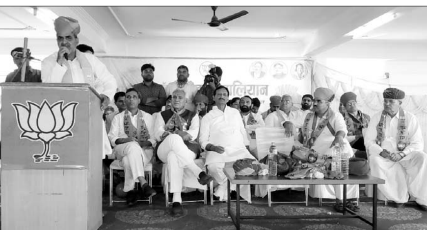
केंद्रीय राज्य मंत्री डेयरी, मत्स्य और गोपालन व केन्द्र से नागौर लोकसभा प्रभारी मंत्री डॉ. संजीव बालियान गुरुवार को परबतसर दौरे पर रहे।

परबतसर, (निसं)। केंद्रीय राज्य मंत्री डेयरी, मत्स्य और गोपालन व केन्द्र से नागौर लोकसभा प्रभारी मंत्री डॉ. संजीव बालियान गुरुवार को परबतसर दौरे पर रहे। इस दौरान उन्होंने चित्रकूट वाटिका में आयोजित भारतीय जनता पार्टी के लोकसभा प्रवास कार्यक्रम के तहत युवा सम्मेलन में शिरकत कर संबोधित किया। इस मौके पर अपने उद्बोधन में संजीव बालियान ने कहा कि आज शहीद दिवस है शहीद होने का काम भात सिंह, सुखदेव जैसे लोगों ने किया था बाकी नेता तो सिर्फ जेल में ऐशोआराम की जिंदगी गुजार कर चले आए।