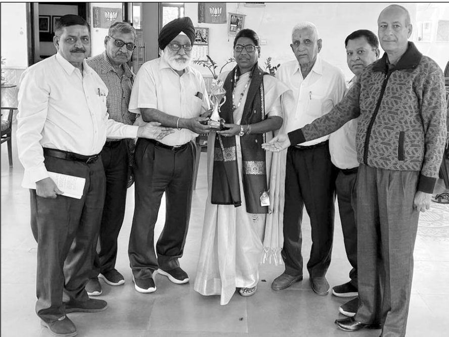
राजस्थान पेंशनर्स समाज द्वारा गुरुवार को अजमेर दक्षिण विधायक अनिता भदेल के समक्ष प्रस्तुत होकर मुख्यमंत्री अशोक गहलोत के नाम ज्ञापन सौंपा।

अजमेर, (कासं)। राजस्थान पेंशनर्स समाज, जिला शाखा, अजमेर द्वारा गुरुवार को अजमेर दक्षिण विधायक अनिता भदेल के समक्ष प्रस्तुत होकर मुख्यमंत्री अशोक गहलोत के नाम ज्ञापन सौंपा। विधायक भदेल ने आश्वासन दिया कि मुख्यमंत्री की ओर राजस्थान पेंशनर्स समाज की मांगों को पुरजोर ढंग से प्रस्तुत कर उनका ध्यान आकर्षित करेंगे।