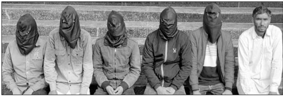
जिला स्पेशल टीम और पीपलू थाना पुलिस की संयुक्त कार्यवाही में 6 आरोपियों को गिरफ्तार किया।

टोंक, (निसं)। पीपलू थाना क्षेत्र में 15 दिन पहले हुई युवक की हत्या के मामले में शुक्रवार को जिला स्पेशल टीम और पीपलू थाना पुलिस की संयुक्त कार्यवाही में 6 आरोपियों को गिरफ्तार किया गया है। मामले में अब तक कुल दस लोगों की गिरफ्तारी हो चुकी है।