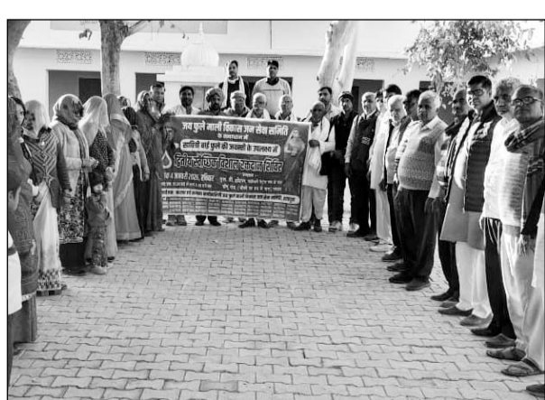
रविवार को होने वाले रक्तदान शिविर के पोस्टर का विमोचन किया।