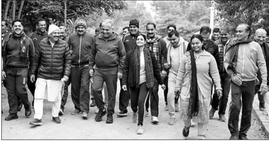
भूपेंद्र यादव ने नमो वन बायोडावर्सिटी पार्क में प्रातः भ्रमण के दौरान आमजन से किया संवाद।

अलवर, (निसं)। केंद्रीय वन, पर्यावरण एवं जलवायु परिवर्तन मंत्री भूपेंद्र यादव ने अलवर प्रवास के दौरान प्रातः भ्रमण नमो वन बायोडावर्सिटी पार्क में किया, इस दौरान सैर पर आये लोगों से उन्होंने जिले के विकास पर संवाद किया।