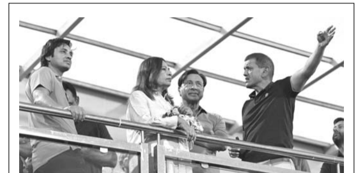
राजस्थान रॉयल के नए मालिक लक्ष्मी निवास मित्तल ने बेटे के साथ एसएमएस स्टेडियम पर टीम को अभ्यास करते देखा।

जीतने के लिए अपनी टीम में बड़े बदलाव कर सकती है। रिपोर्ट में यह भी कहा गया है कि सूर्यकुमार यादव का बल्ले से खराब प्रदर्शन भारत के अगले टी20 कप्तान के रूप में उनकी भूमिका में बदलाव का एक प्रमुख कारण हो सकता है। उन्होंने टी20 विश्व कप में नौ पारियों में 242 रन बनाए, जिनमें से 84 रन उन्होंने अमेरिका के खिलाफ बनाए थे। भारतीय कप्तान मौजूदा आईपीएल (इंडियन प्रीमियर लीग) 2026 में मुंबई इंडियंस के लिए भी संघर्ष कर रहे हैं, जहां पांच बार की चैंपियन टीम अंक तालिका में नौवें स्थान पर है।