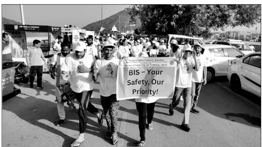
उदयपुर की फतेहसागर झील पर “रन फॉर क्वालिटी” का आयोजन हुआ।।