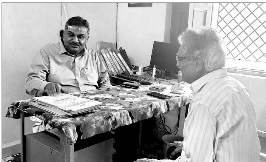
नवजीवन वृद्धाश्रम का निरीक्षण कर जानकारी लेते जिला विधिक सेवा प्राधिकरण सचिव कौशल सिंह।

बांसवाड़ा, (निसं)। जिला विधिक सेवा प्राधिकरण के सचिव व अपर जिला न्यायाधीश कौशल सिंह ने जिला कारागृह का आकस्मिक निरीक्षण कर कारागृह में कैदियों को उपलब्ध कराई जा रही सुविधाओं की जानकारी ली। निरीक्षण के दौरान जिला कारागृह में समस्त बैरक, भोजनशाला, महिला बैरक, शौचालय व स्नानघर में साफ-सफाई आदि व्यवस्थाएं संतोषजनक पाई गईं। सचिव सिंह ने निरीक्षण के दौरान उपस्थित 291 पुरुष बंदी व 12 महिला